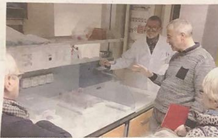
La consegna del macchinario e la visita dell'Istituto