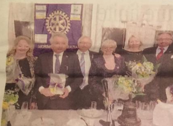
BUON COMPLEANNO Il Rotary Club Morimondo Abbazia