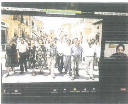
EVENTO ONLINE Mercoledì ospite Stefano Schifano

Loro, o meglio del rodato tandem Tornatore-Schifano, è il bellissimo cortometraggio La stanza degli abbracci: il video promo trasmesso dalle reti nazionali sull'importanza di vaccinarsi contro in Covid-19 che vede protagoniste un'anziana nonna ricoverata in una struttura protetta e la sua giovane nipote indecisa sul da farsi.