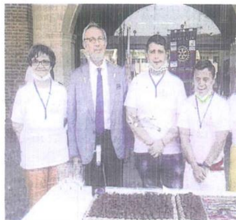
SFILATA DI GIOIELLI Sopra: i promotori dell'iniziativa

pandemia di Rotary Historica, che quest'anno ha preso il nome di «Abbey Road», in quanto la carovana è partita dal piazzale dell'Abbazia di Morimondo per poi toccare altre due abbazie cistercensi del Milanese: