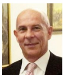
Vice Presidente e Formazione Club