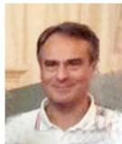
Consigliere Osp. e Comm. Int.