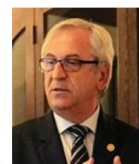
Segr. Esecutivo e Imm. Pubblica