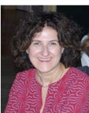
Consigliere Osp. e RYE