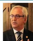
Segr. Esecutivo e Imm. Pubblica