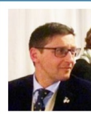
Consigliere e Comm. Eventi