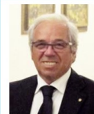
Consigliere e Comm. Effettivo