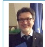
Consigliere e Fondazione RI