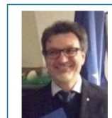
Consigliere e Fondazione RI