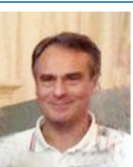
Consigliere Osp. e Comm. Int.