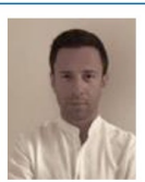
Tesoriere e Pres. Nominato