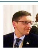
Consigliere e Comm. Eventi