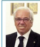
Consigliere e Comm. Effettivo