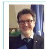
Consigliere e Fondazione RI