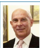
Vice Presidente e Formazione Club