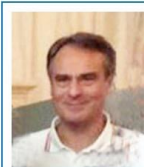
Consigliere Osp. e Comm. Int.