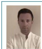
Tesoriere e Pres. Nominato