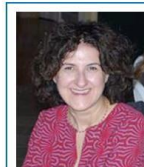
Consigliere Osp. e RYE