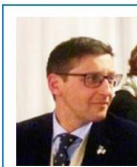
Consigliere e Comm. Eventi