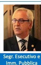
Segr. Esecutivo e Imm. Pubblica