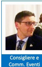
Consigliere e Comm. Eventi