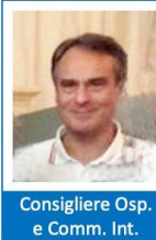
Consigliere Osp. e Comm. Int.