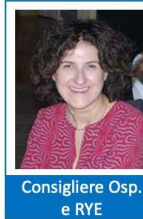
Consigliere Osp. e RYE