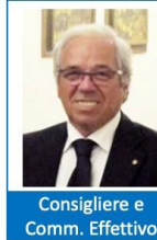
Consigliere e Comm. Effettivo