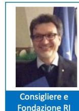
Consigliere e Fondazione RI