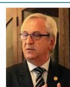
Segr. Esecutivo e Imm. Pubblica