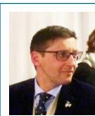
Consigliere e Comm. Eventi